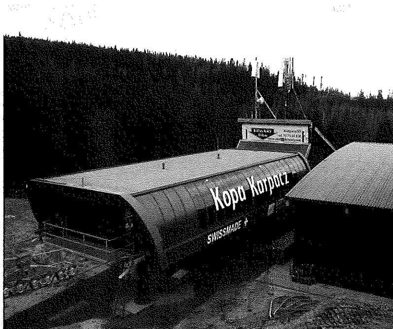
Załącznik nr 1: Widok ogólny instalacji radiokomunikacyjnej.