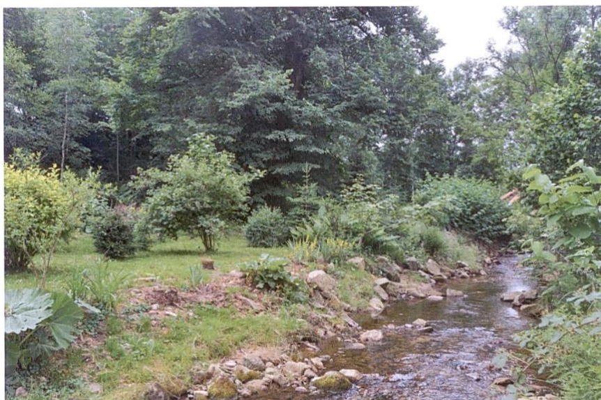
Widok od strony Potoku Karpnickiego