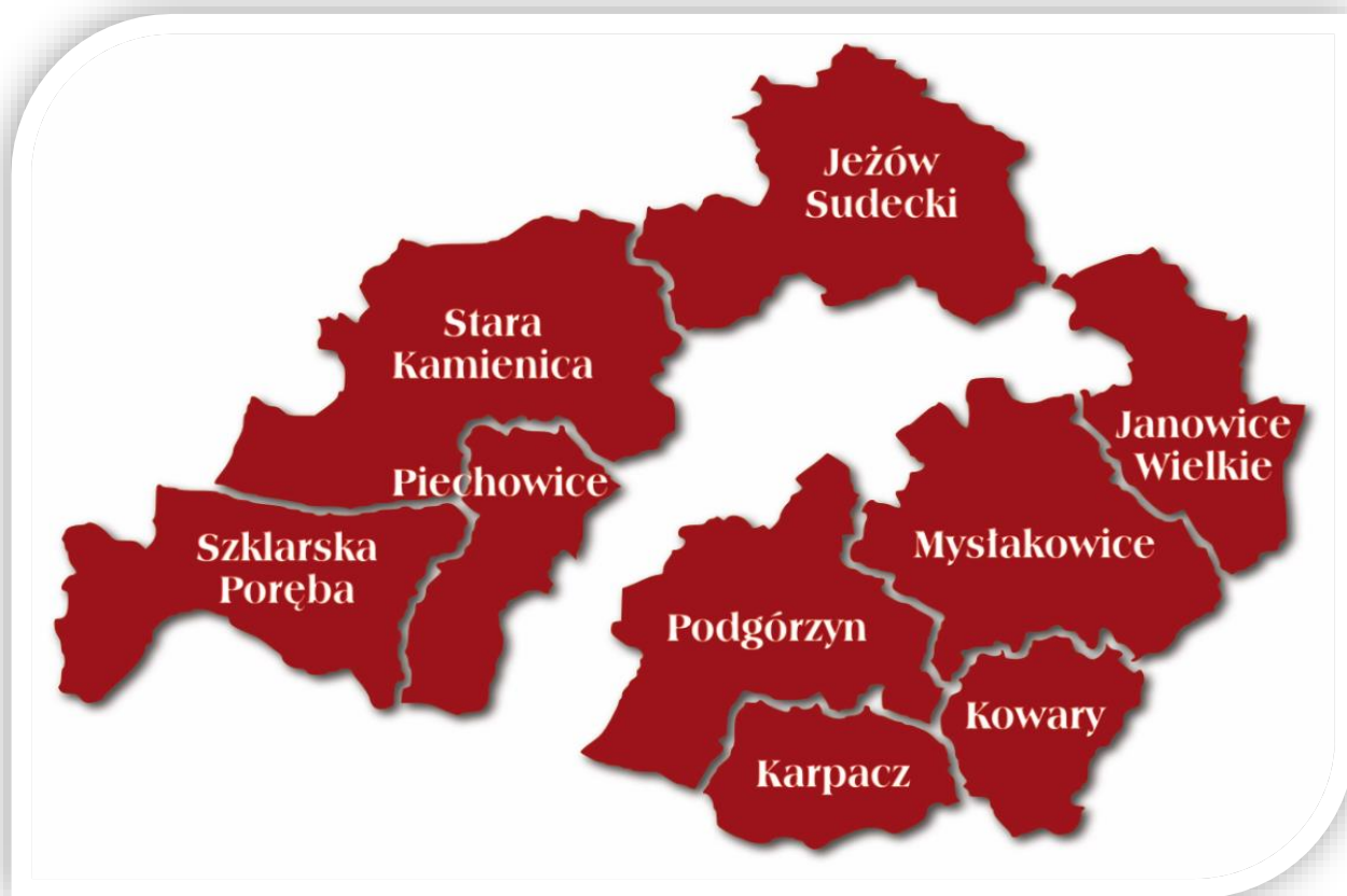
Mapa: Mapa Powiatu Karkonoskiego

Powiat karkonoski położony jest w południowo-zachodniej części województwa dolnośląskiego. Od zachodu i północno-zachodu graniczy z powiatem lwóweckim, od północy z powiatem złotoryjskim, od wschodu z powiatami: jaworskim i kamiennogórskim, a od południa z Republiką Czeską. Powiat karkonoski otoczony jest pasmami górskimi, od zachodu znajdują się Góry Izerskie i Pogórze Izerskie, od północy Góry Kaczawskie, od wschodu Rudawy Janowickie, a od południa Karkonosze. Administracyjny obszar powiatu karkonoskiego wynosi 627,1 km 2 . Na tym terenie funkcjonuje 5 gmin wiejskich: Janowice Wielkie, Jeżów Sudecki, Mysłakowice, Podgórzyn i Stara Kamienica, w tym 46 miejscowości wiejskich oraz 4 gminy miejskie: Karpacz, Kowary, Szklarska Poręba oraz Piechowice.