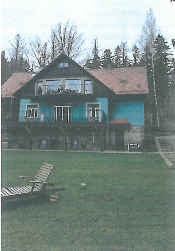
Widok obiektu wraz z zainstalowanym zespołem antenowym